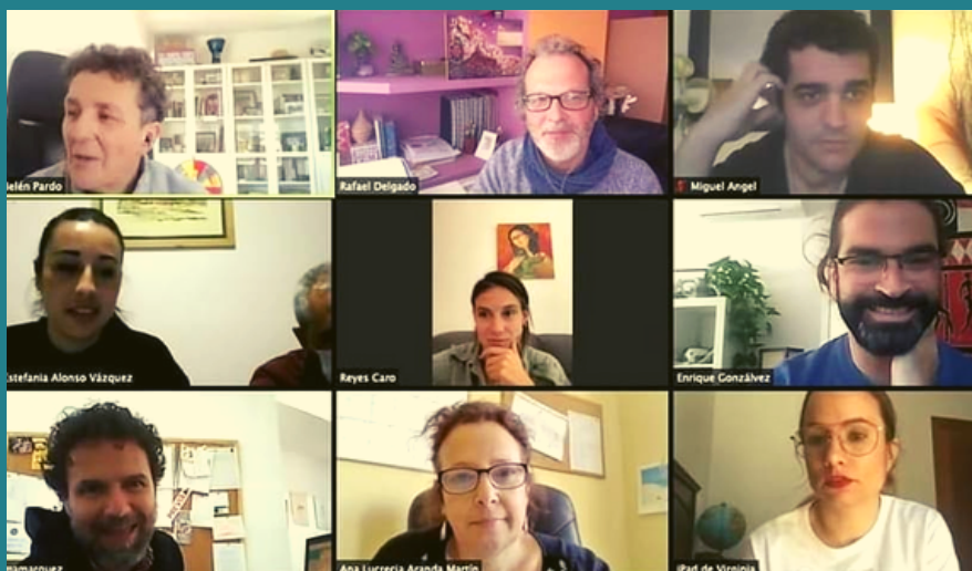
Reunión de personal técnico de Prevención

Pocos días después y tras la declaración del Estado de Alarma y las medidas de confinamiento, los presidentes y presidentas integrantes de la Asociación Andaluza, siguieron desarrollando su trabajo en la distancia y gracias a las reuniones telemáticas, pudimos mantener la comunicación para la gestión autonómica. Nuestro personal técnico de las entidades provinciales tampoco dejó de preparar reuniones y de seguir con la gestión del IRPF andaluz, Comisión de Género, Prevención o Voluntariado.